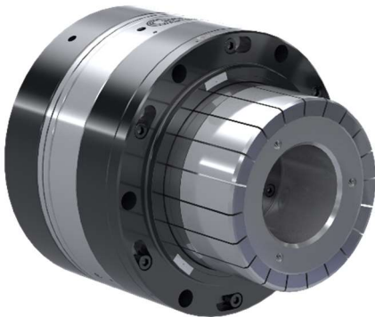
Abb.5: 9100471_Aufspannung 1

Weitere Produkteigenschaften wie rückziehbare Anschläge, Dämpfungselemente oder Schnellwechsel-Schnittstellen zur Rüstzeiteinsparung lassen sich in der Regel je nach Kundenwunsch problemlos integrieren.