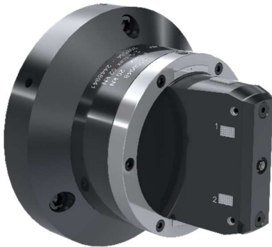
Abb.4: 9100948 Gleitbackenspanndorn_Anschlag

Auch im Bereich der kundenspezifischen Sonderlösungen kann SMW-Autoblok auf ein großes und stetig wachsendes Erfahrungsspektrum zurückgreifen. So kommen für komplexe Spannaufgaben häufig Gleitbackenspanndorne zum Einsatz, da diese eine extrem hohe Genauigkeit bieten und gleichzeitig sehr flexibel einsetzbar sind.