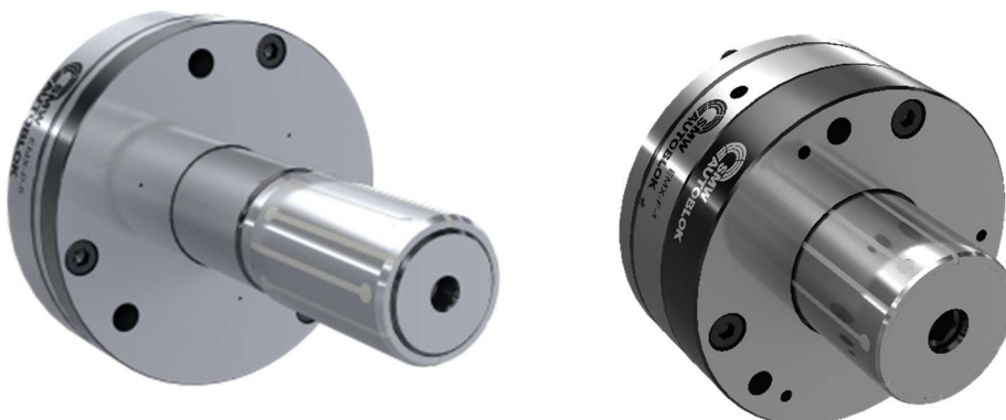
Abb.3: EMX-P-6 und EMX-F-FP-4

Mittels spezifischer Wechselteile können die EMX Premium Spanndorne exakt auf die Anwendungen und Bedürfnisse der Kunden zugeschnitten werden.