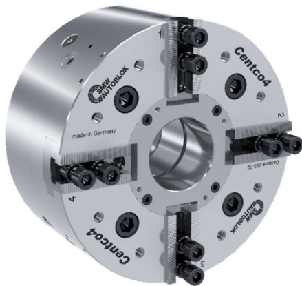
Abb.1: Centco4_Version_neu2020_mit Backen

Einsatzflexibilität weiter ab. Durch die standardisierte Backenschnittstelle ist zudem eine umfangreiche Auswahl an Standardbacken nutzbar.